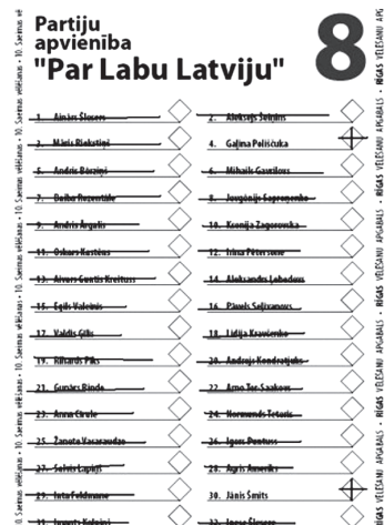
Рис. 3. Приклад голосування за бюлетенем в Латвії

На першому етапі підрахунку голосів рахуються дійсні голоси, віддані за той чи інший список кандидатів. На другому етапі дійсні виборчі бюлетені розділяються на дві групи – змінені та незмінні. Зміненими вважаються ті виборчі бюлетені, в